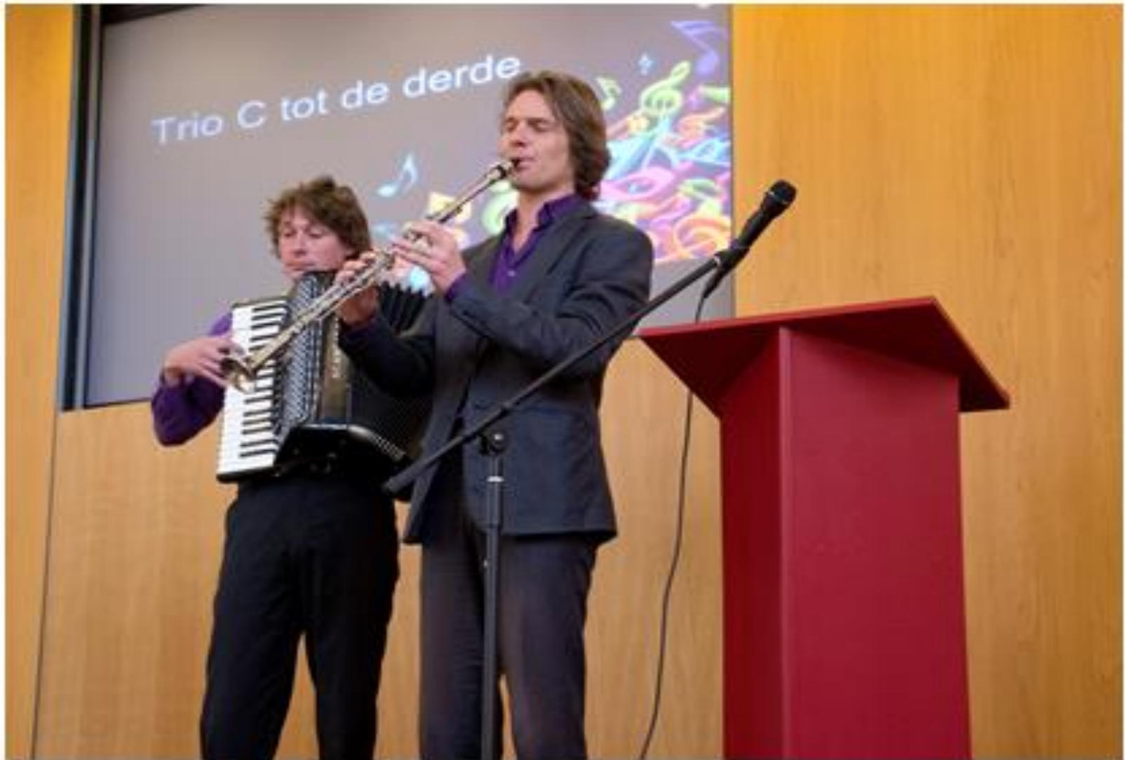
Twee vertegenwoordigers van Tro c tot de derde