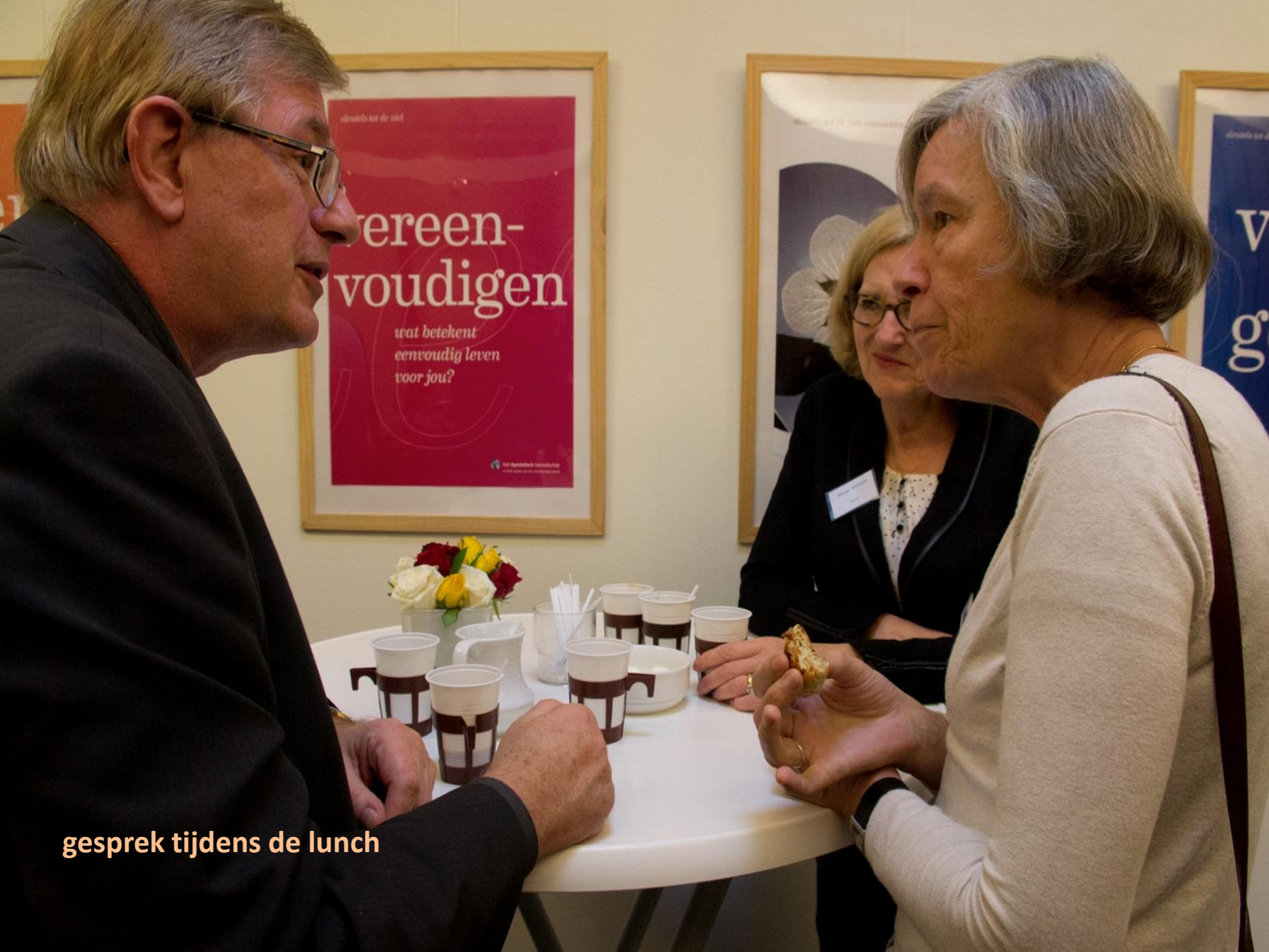
gesprek tijdens de lunch