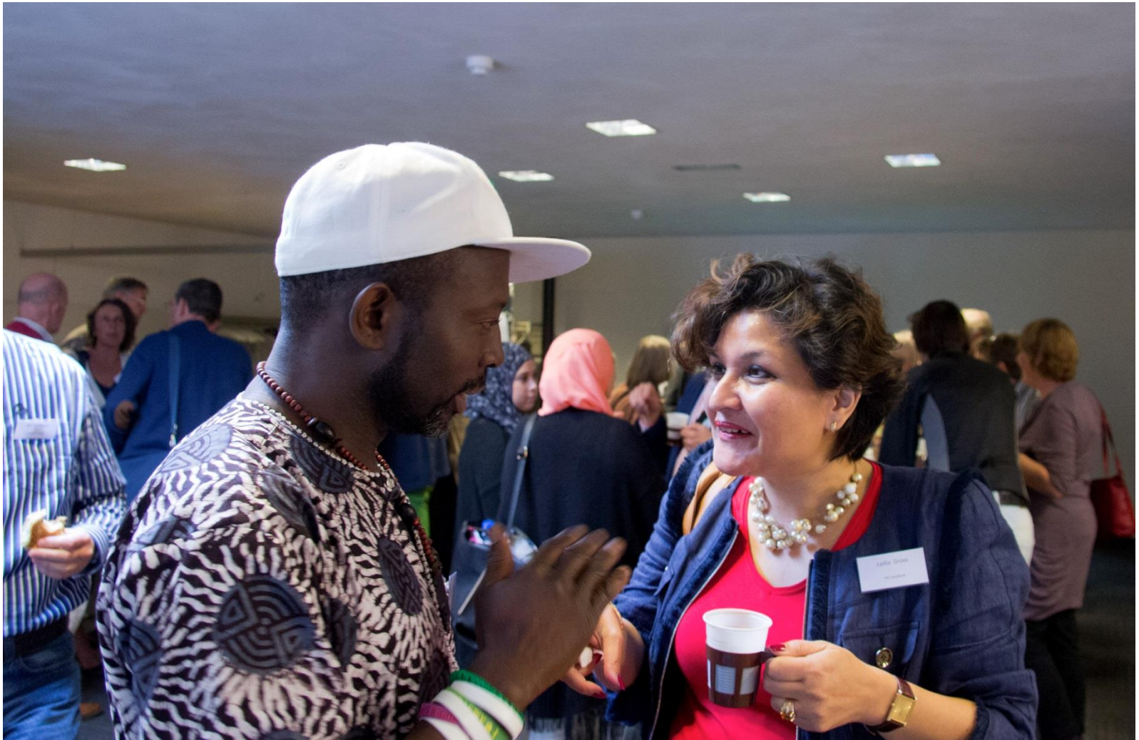
tijdens de lunch