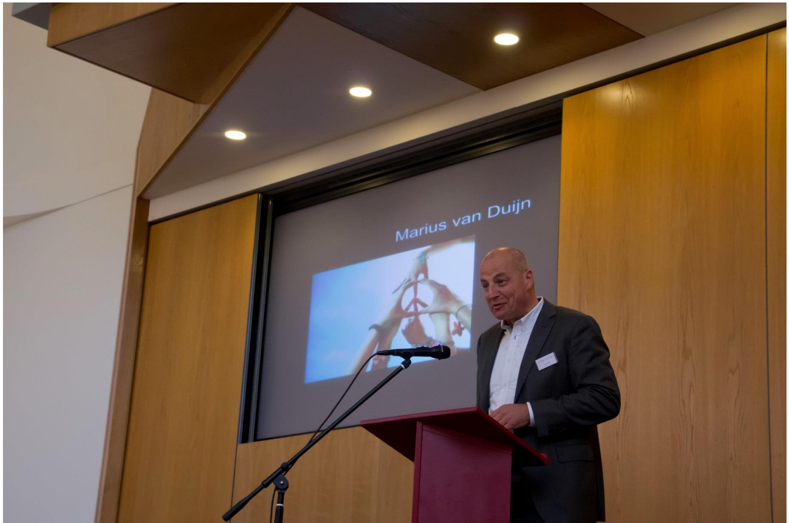
reactie op de keynote