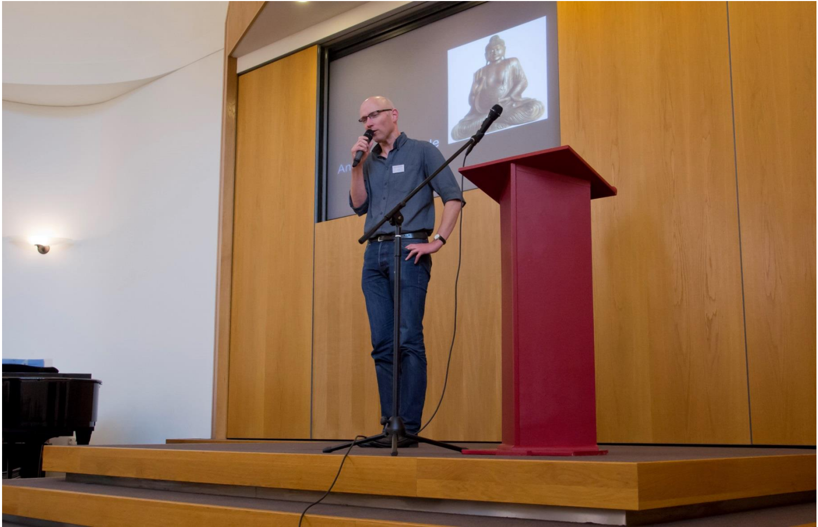
reactie op de keynote