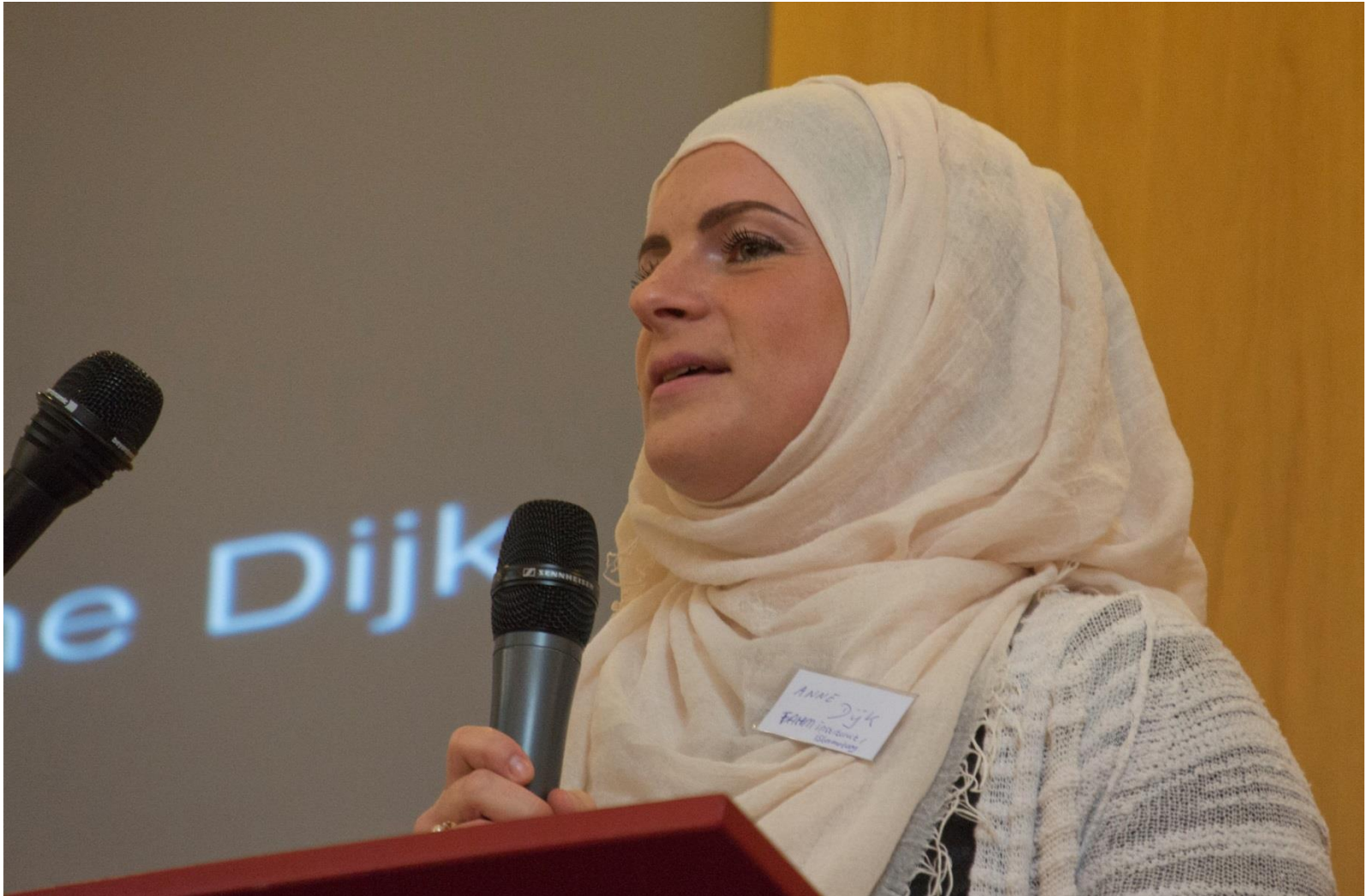
reactie op de keynote