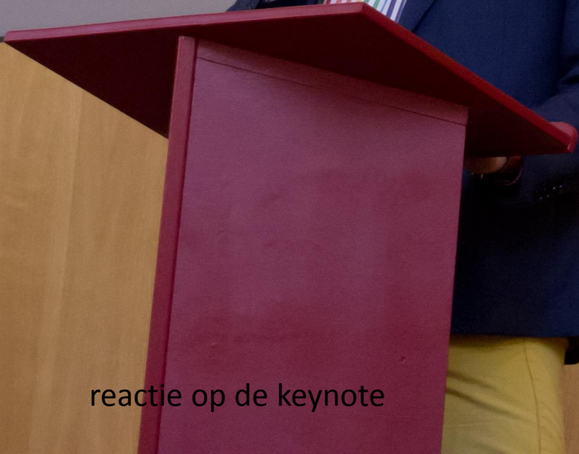
reactie op de keynote